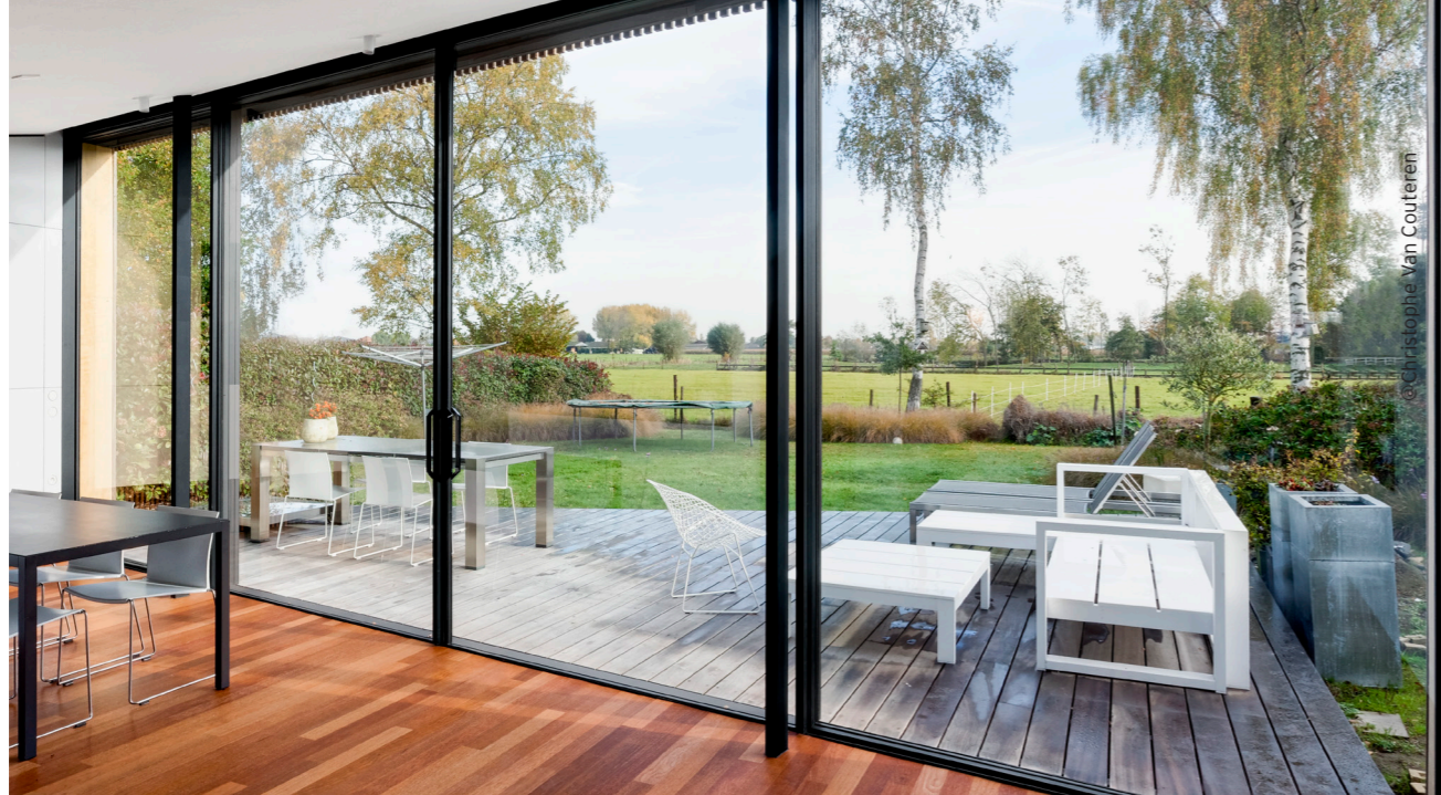
@Christophe Van Couteren