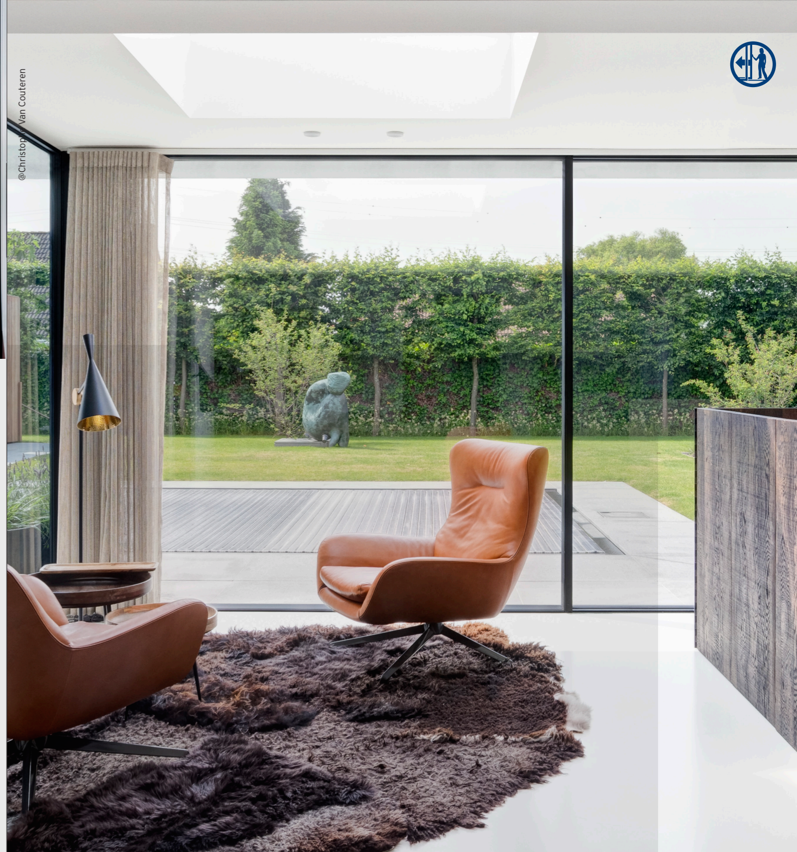
@Christophe Van Couteren